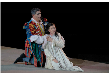
Luca Salsi și Lisette Oropesa

Bufonul a fost interpretat de italianul Luca Salsi, o voce solidă, dominatoare, de extracție verdiană, în care așteptatele moliciuni și-au făcut loc în „Miei signori... perdono, pietà” din aria „Cortigiani” sau „Piangi, fanciulla” din duet. Finalul actului, cu un colosal La bemol acut, m-a făcut să regret că, până atunci, baritonul a ales o versiune de arie fără note înalte. Ușor forțat de Salsi, bisul duetului „Sì, vendetta” a trebuit să fie acordat, în fața entuziastei asistențe.